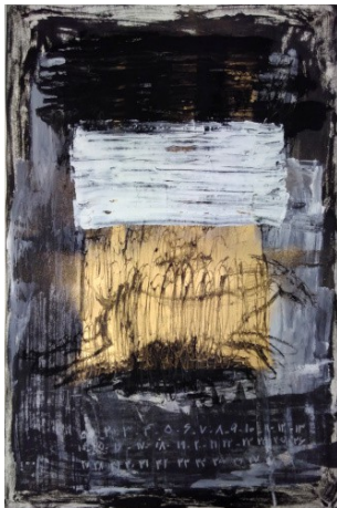
Sevil Amini: o.T., Mischtechnik auf Papier

http://www.dieartothek.de/presse/presseFoto2.jpg