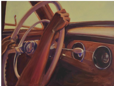
Chantal Maquet: Am Steuer , Öl auf Leinwand © die artothek 2015, Foto: Matthias Schwarze

http://www.dieartothek.de/presse/presseFoto1.jpg