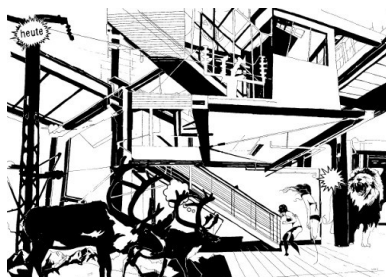
ZAZA: heute , Filzstift auf Kappaboard © die artothek 2015, Foto: Matthias Schwarze

http://www.dieartothek.de/presse/presseFoto3.jpg